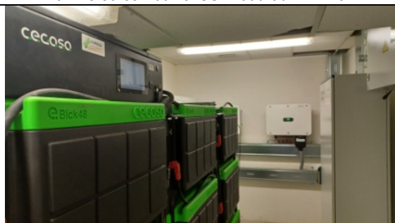
Acumulación en baterías de 322 kWh (2 strings de 12 módulos Cegasa eBick Pro 280)