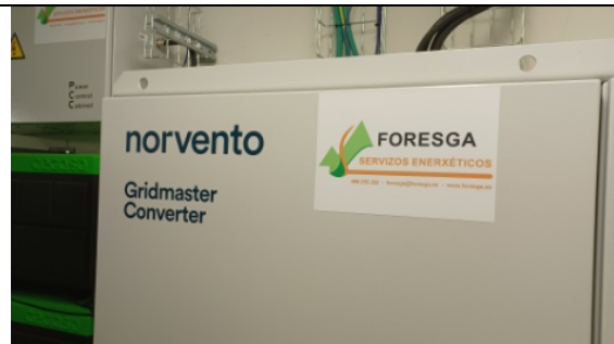
Cadro CA e convertidor Norvento Gridmaster 100 kVA