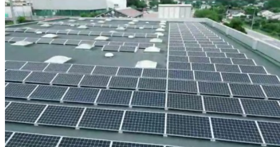
278 paneis solares Sunpower Maxeon 3 de 400W, 111.200 Wp totais