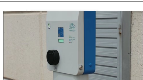
Cargador vehículo eléctrico trifásico Orbis Viaris City de 43 kW 3x63A