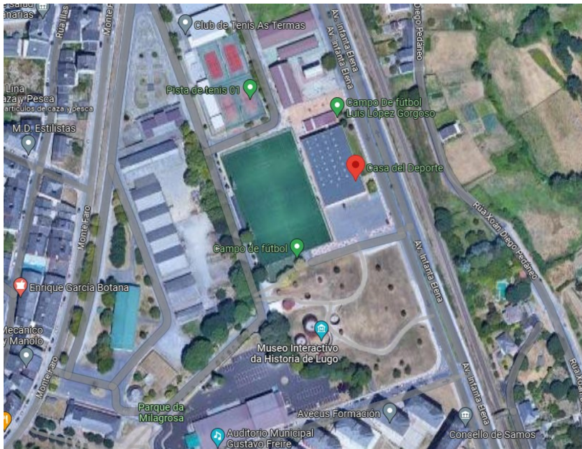
UBICACIÓN DEL CARTEL