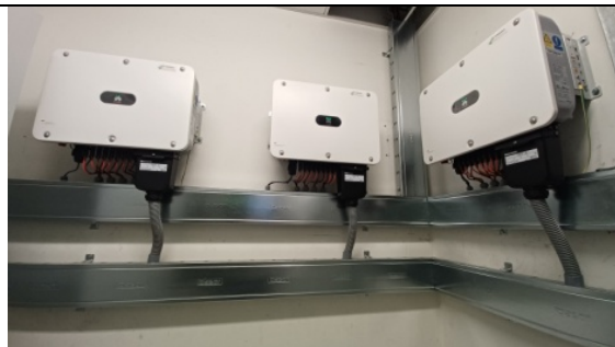
3 inversores Huawei SUN2000-30 KTL M3