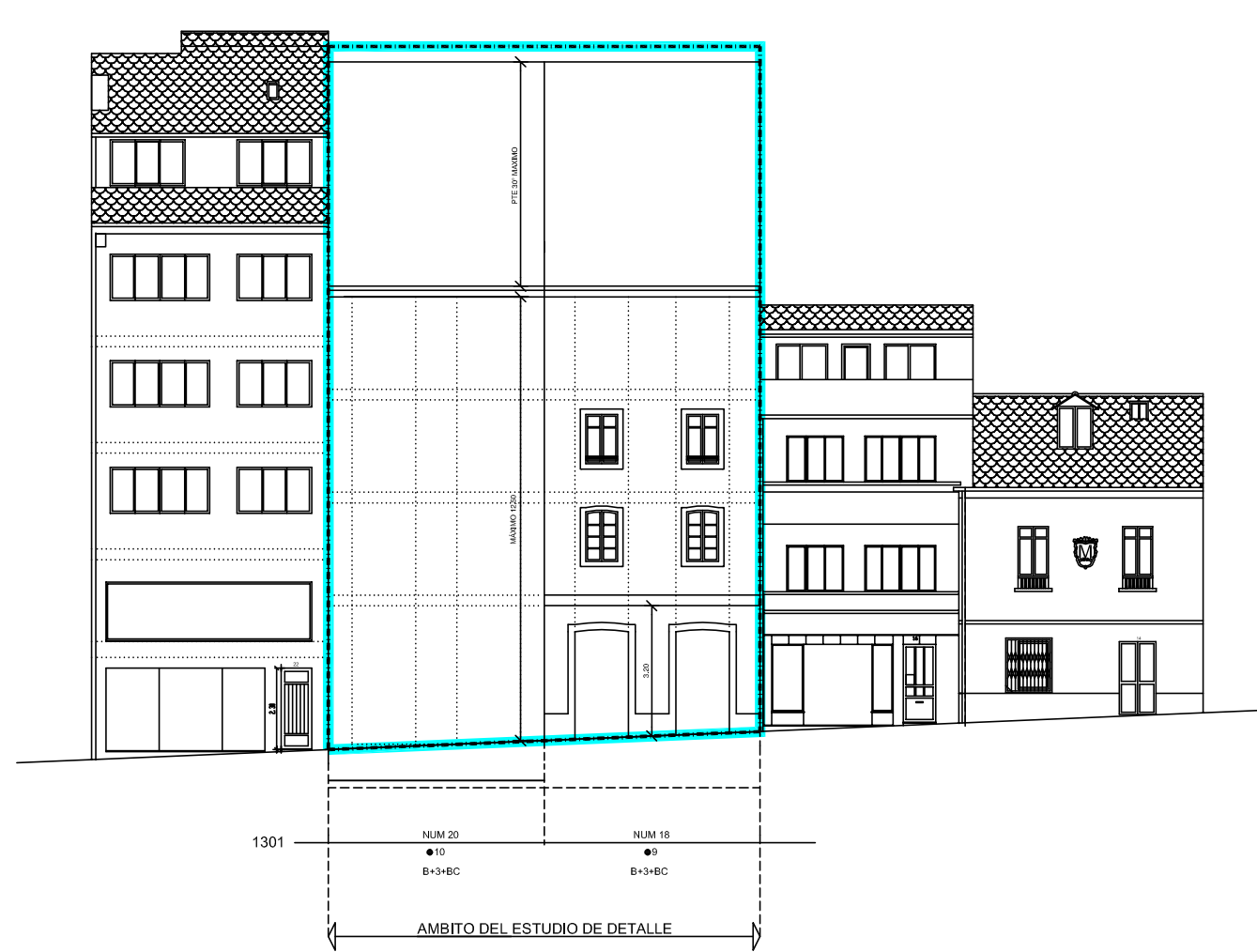
ALZADOS CON FRENTE A CALLE SAN FROILAN