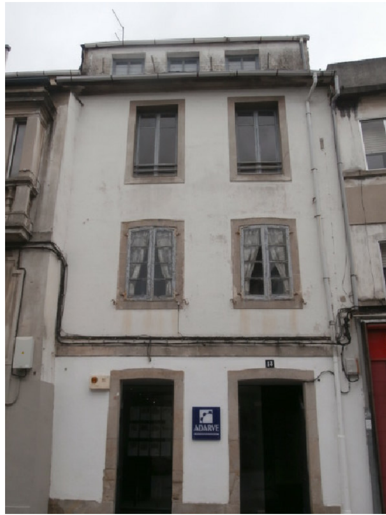
ALZADO FRONTAL RUA SAN FROILAN Nº18