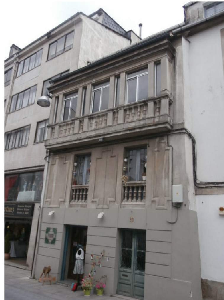
ALZADO FRONTAL RUA SAN FROILAN Nº20