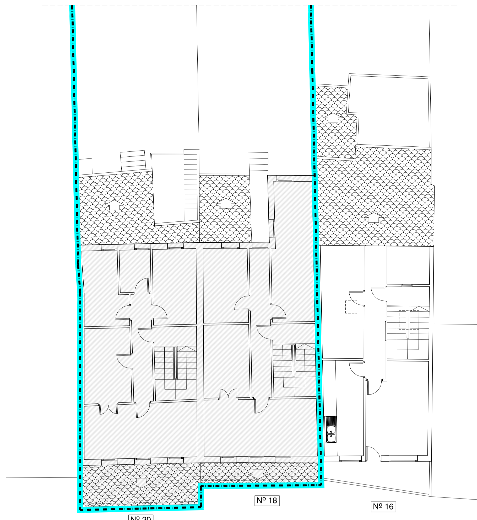
RUA SAN FROILAN

S.CONSTRUIDA: N° 20..... 95.41 m 2 N° 18.....80.00 m 2 N° 16.....112.39 m 2