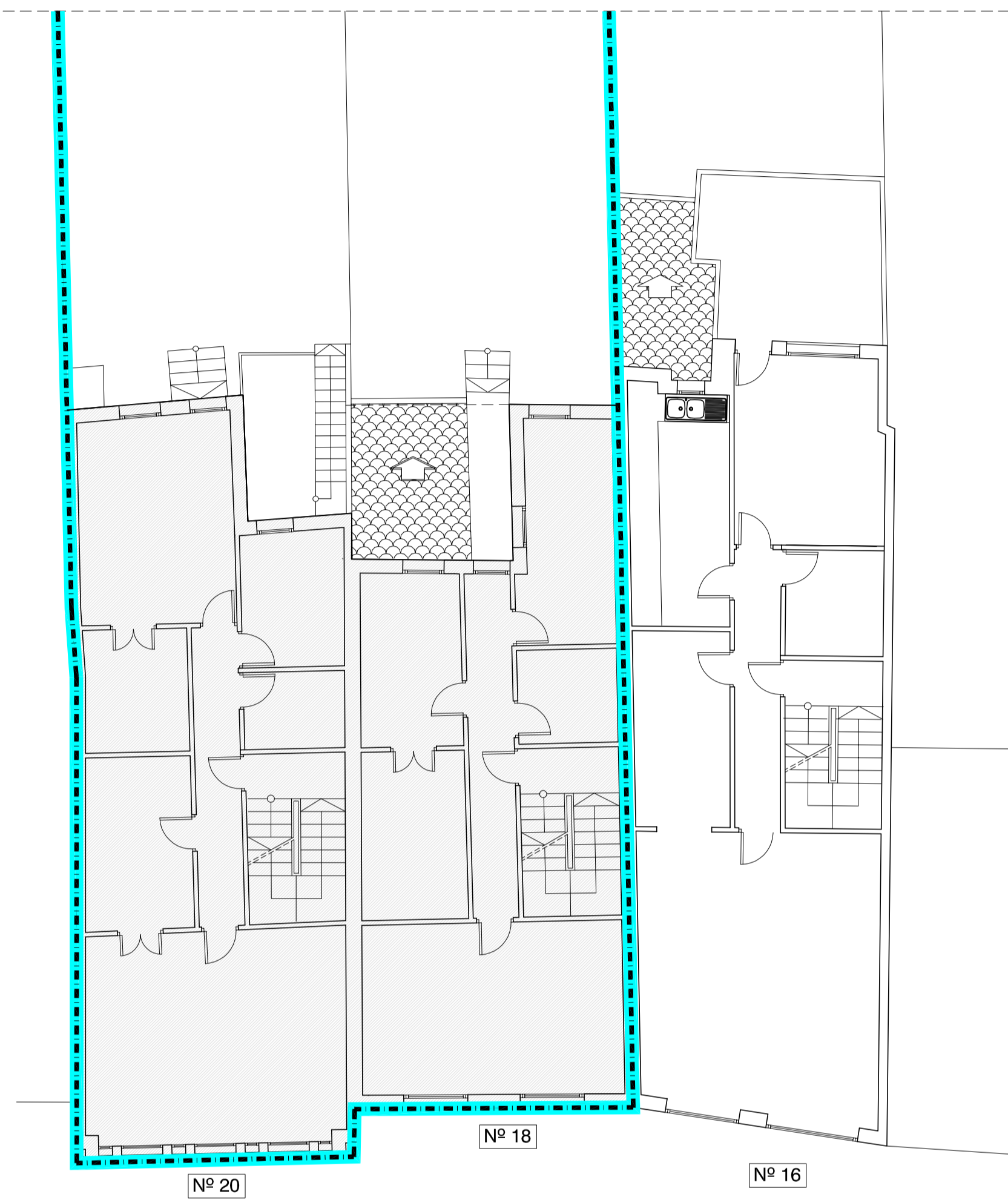
RUA SAN FROILAN