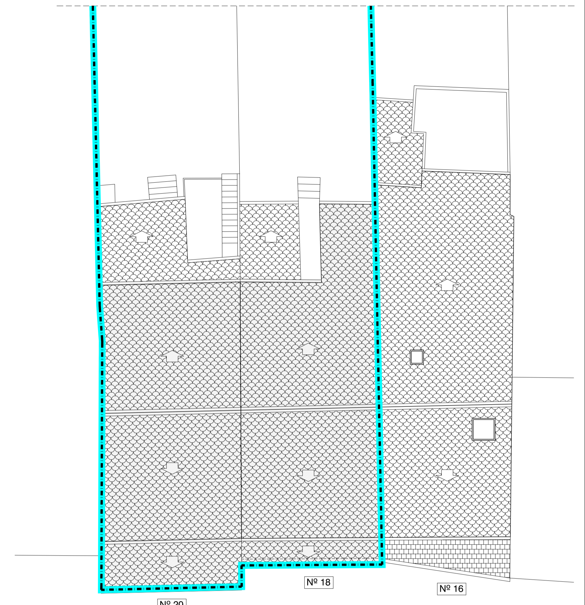
RUA SAN FROILAN

S.CONSTRUIDA: N° 20..... 67.35 m 2 N° 18.....74.48 m 2 N° 16.....62.27 m 2