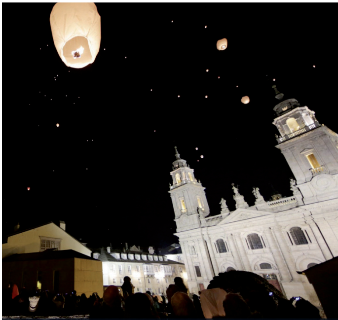
Solta de "pequenos farois" desde o adarve da Muralla. Día 30 ás 22.00 h.