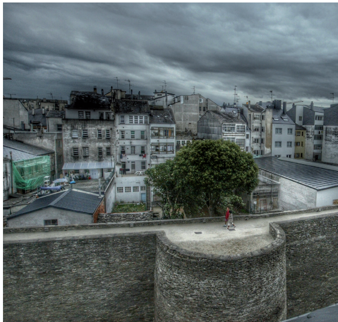
para a Exposición "Feitas con móbil"