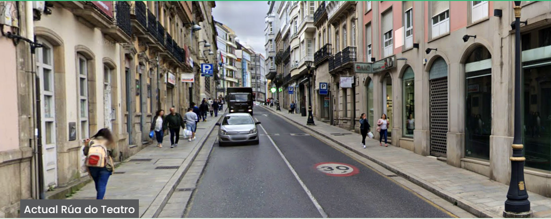
Actual Rúa do Teatro

Con motivo das obras de peonalización integral e renaturalización do centro histórico, postas en marcha polo Goberno de Lara Méndez e financiadas polos fondos Europeos Next Generation e, para evitar o maior grado de afectación posible, achegámosche este plan de tráfico co fin de que coñezas, de primeira man, como afectará ao tráfico na contorna.