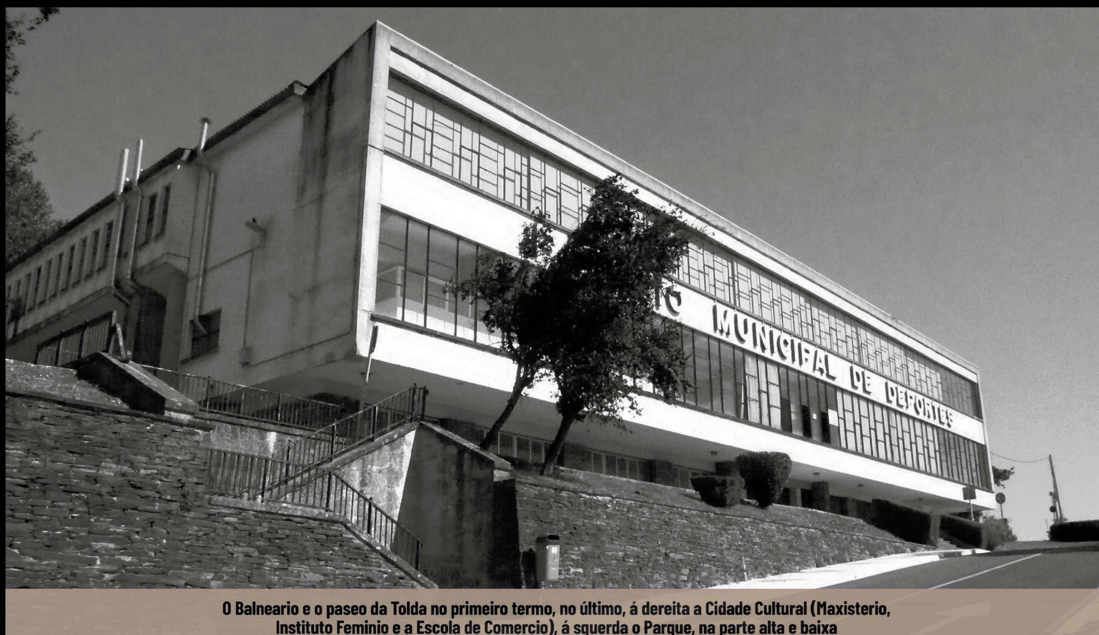
O Balneario e o paseo da Tolda no primeiro termo, no último, á dereita a Cidade Cultural (Maxisterio, Instituto Feminio e a Escola de Comercio), á esquerda o Parque, na parte alta e baixa