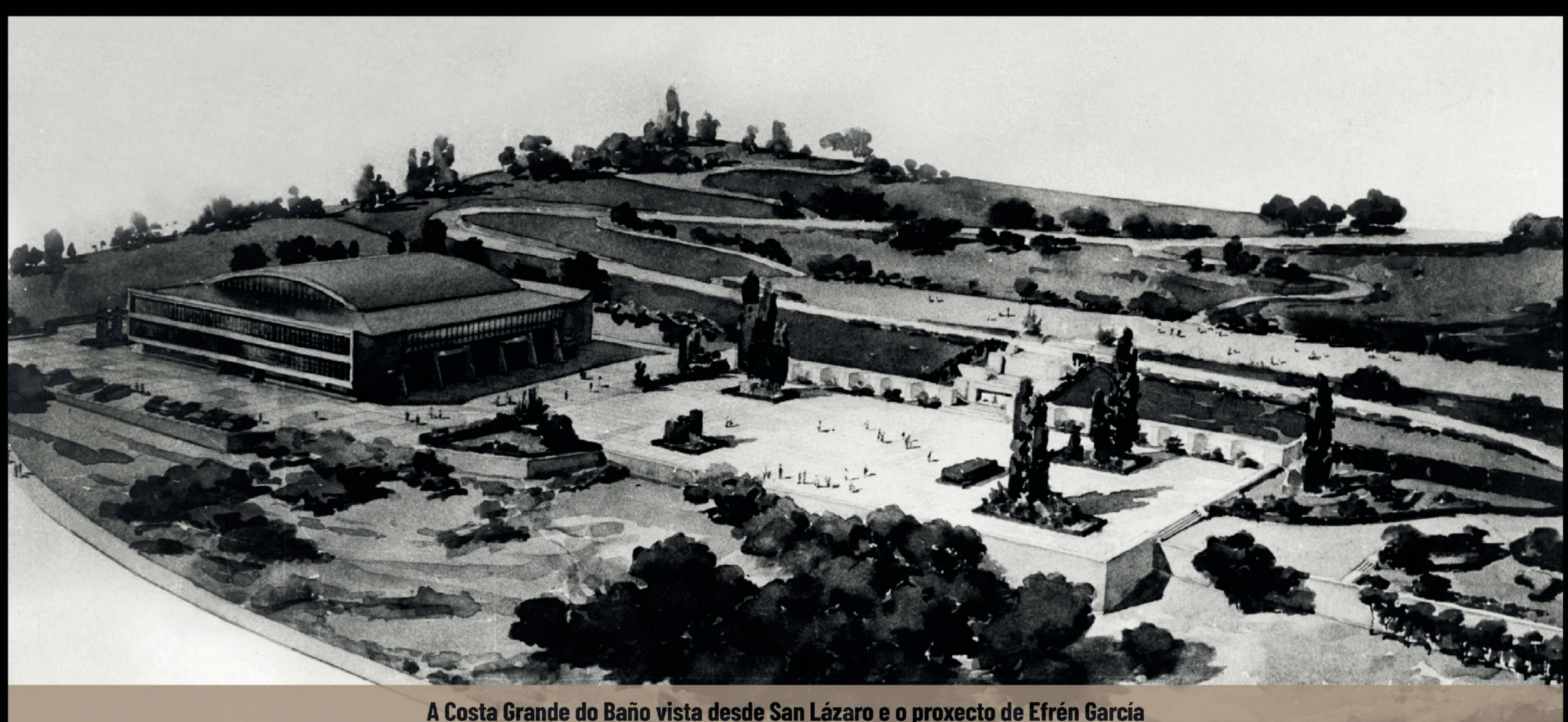
A Costa Grande do Baño vista desde San Lázaro e o proxecto de Efrén García

Ante o crecemento pola afección aos deportes e o clima lucense, na