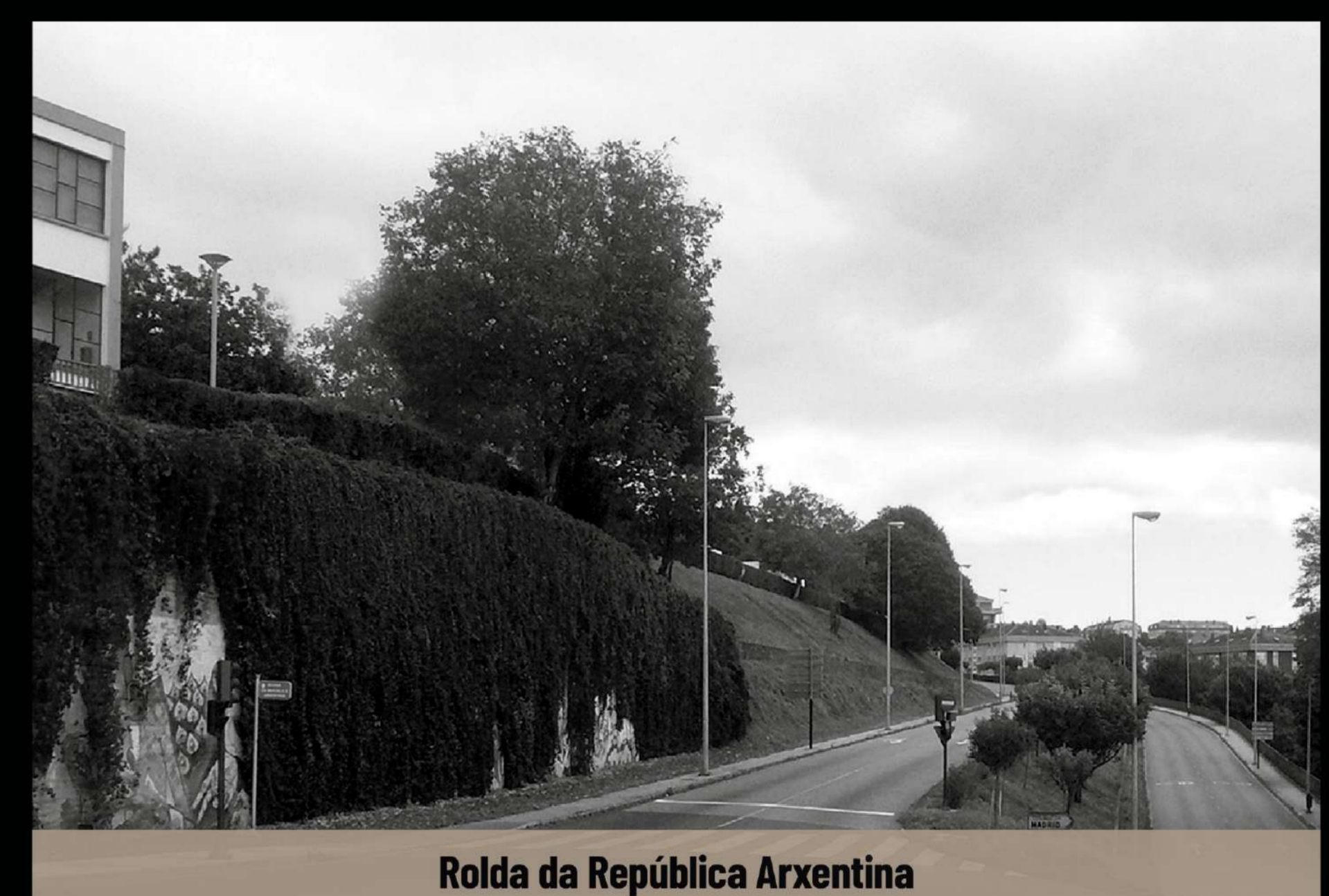
Rolda da República Arxentina

En 1969, a apertura da Segunda Rolda, á que se lle deu o nome de Avenida de República Arxentina, afectou á parte inferior das Costas do Parque, a antiga Costa Grande do Baño.