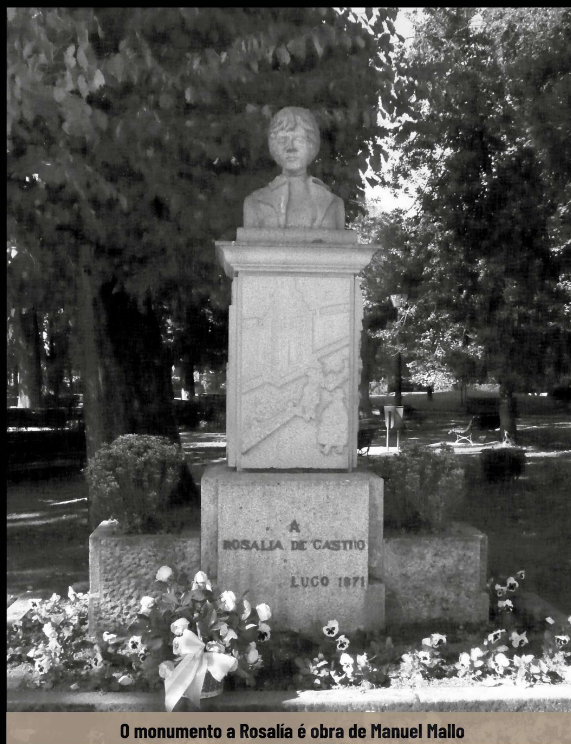
O monumento a Rosalía é obra de Manuel Mallo

tiña as ás despregadas pero por temor aos vendavais a derrubasen, fíxose con elas pregadas. As críticas fixeron que se substituíse por outra coas ás despregadas.