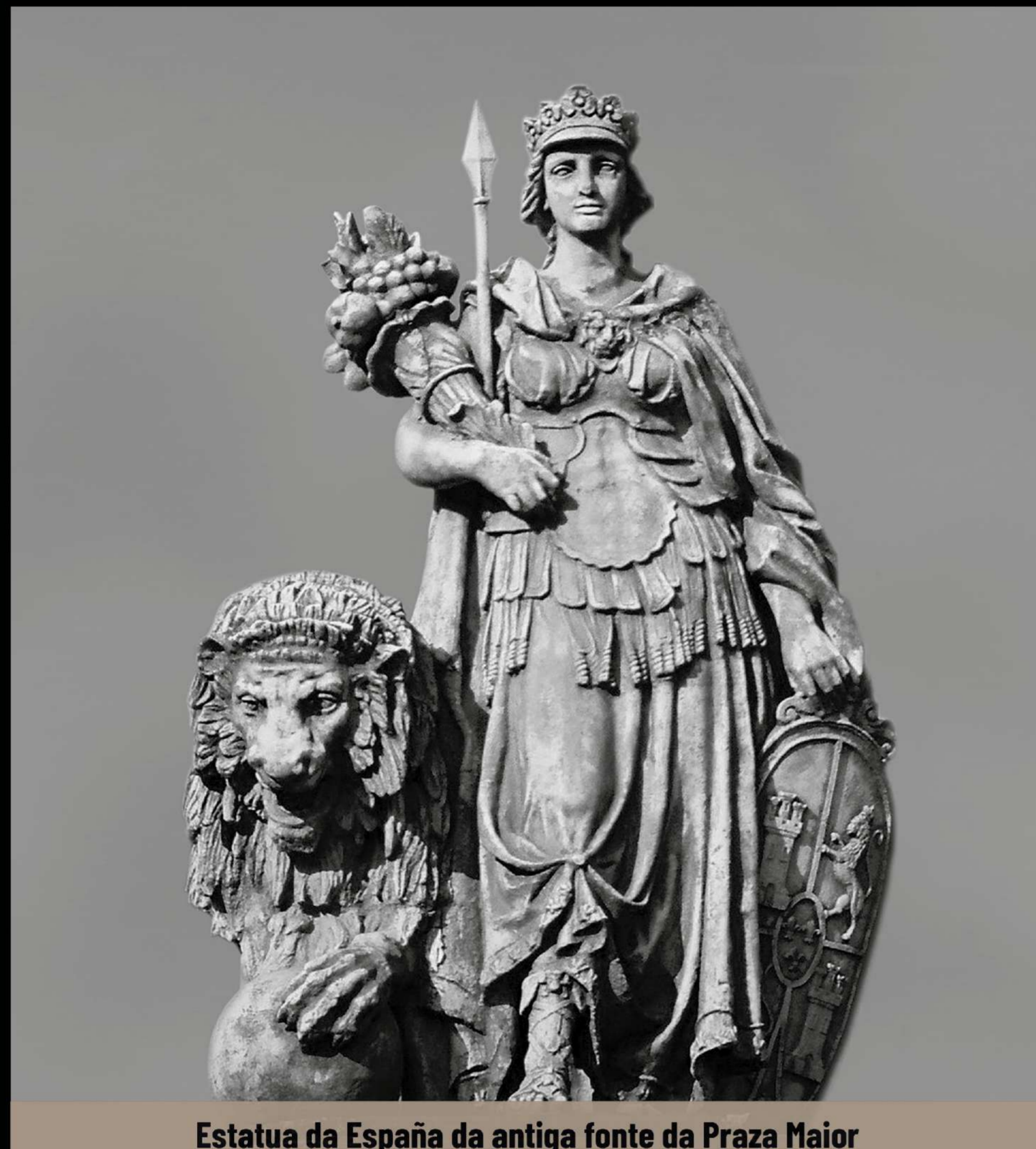
Estatua da España da antiga fonte da Praza Maior