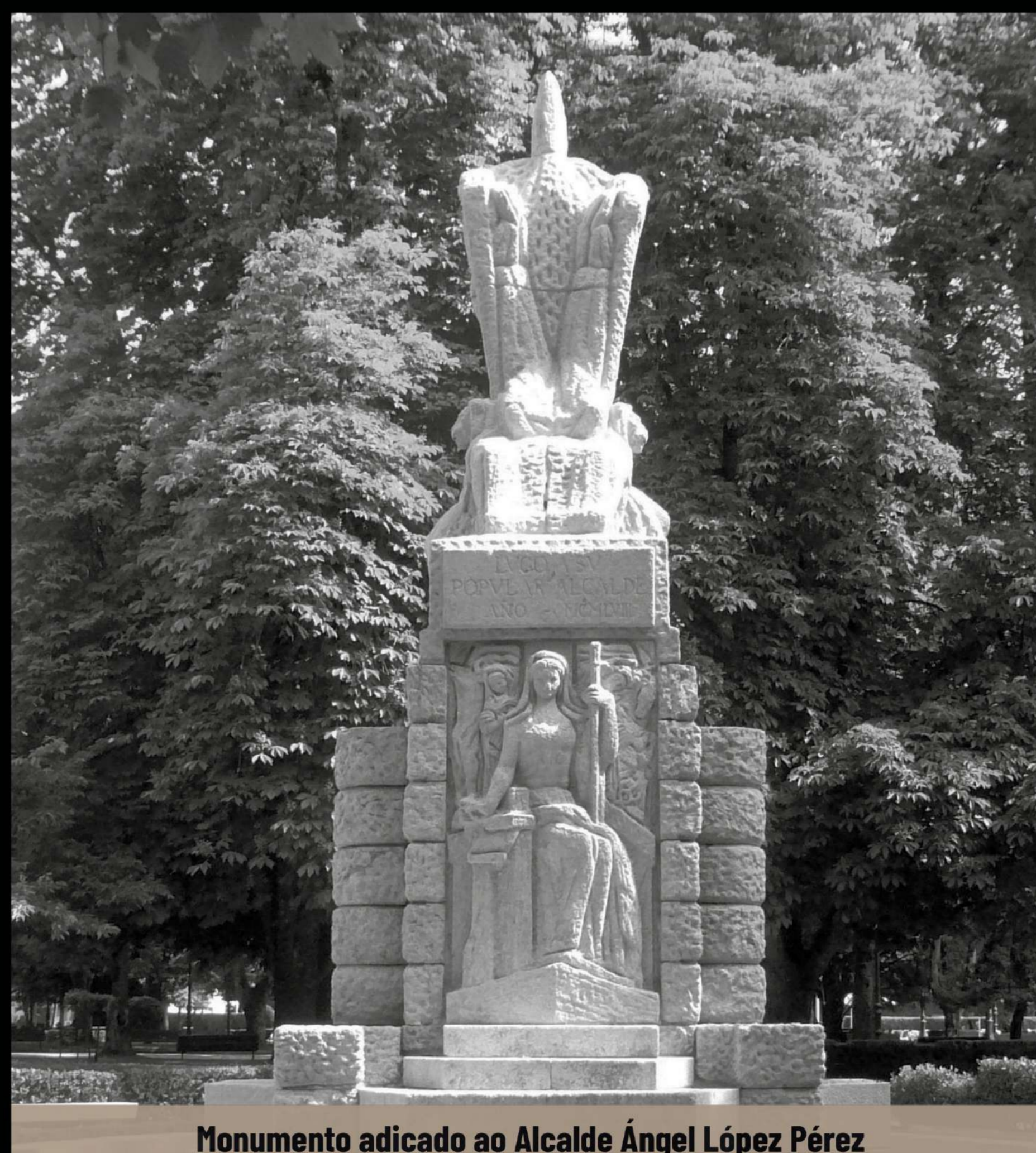
Monumento adicado ao Alcalde Ángel López Pérez

No lugar onde estivo a primeira fonte fíxose a pía circular da fonte actual e posteriormente a árbore en cuxas caras vanse alternado os dous motivos xacobeos, a vieira ou cuncha de peregrino, e a cruz de Santiago, e dous pratos que recollen a auga.