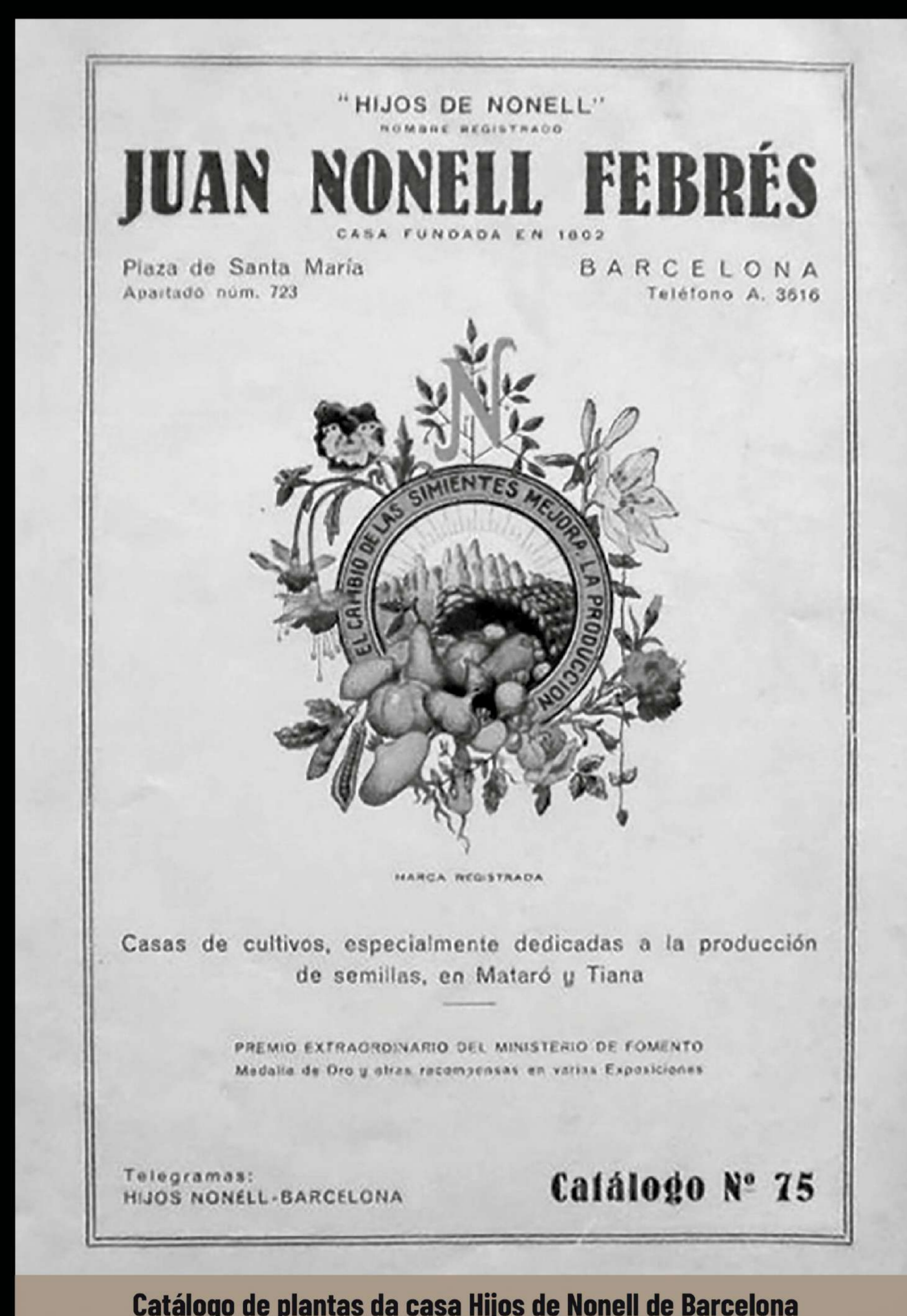
Catálogo de plantas da casa Hijos de Nonell de Barcelona