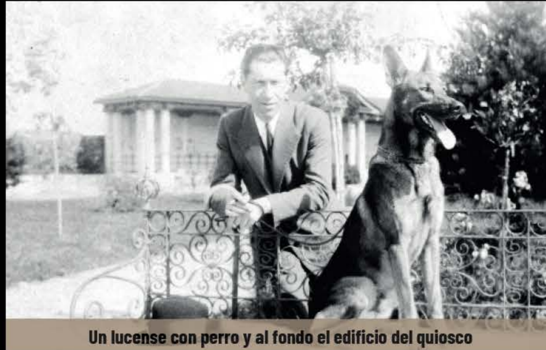
Un lucense con perro y al fondo el edificio del quiosco

La actual cafetería situada en el Parque, conocida como "Mirador Rosalía de Castro", tuvo un precedente en el llamado Café Venecia en la década de los años 30 del siglo pasado. Por fotografías sabemos que se situó en el paseo central, a la altura del