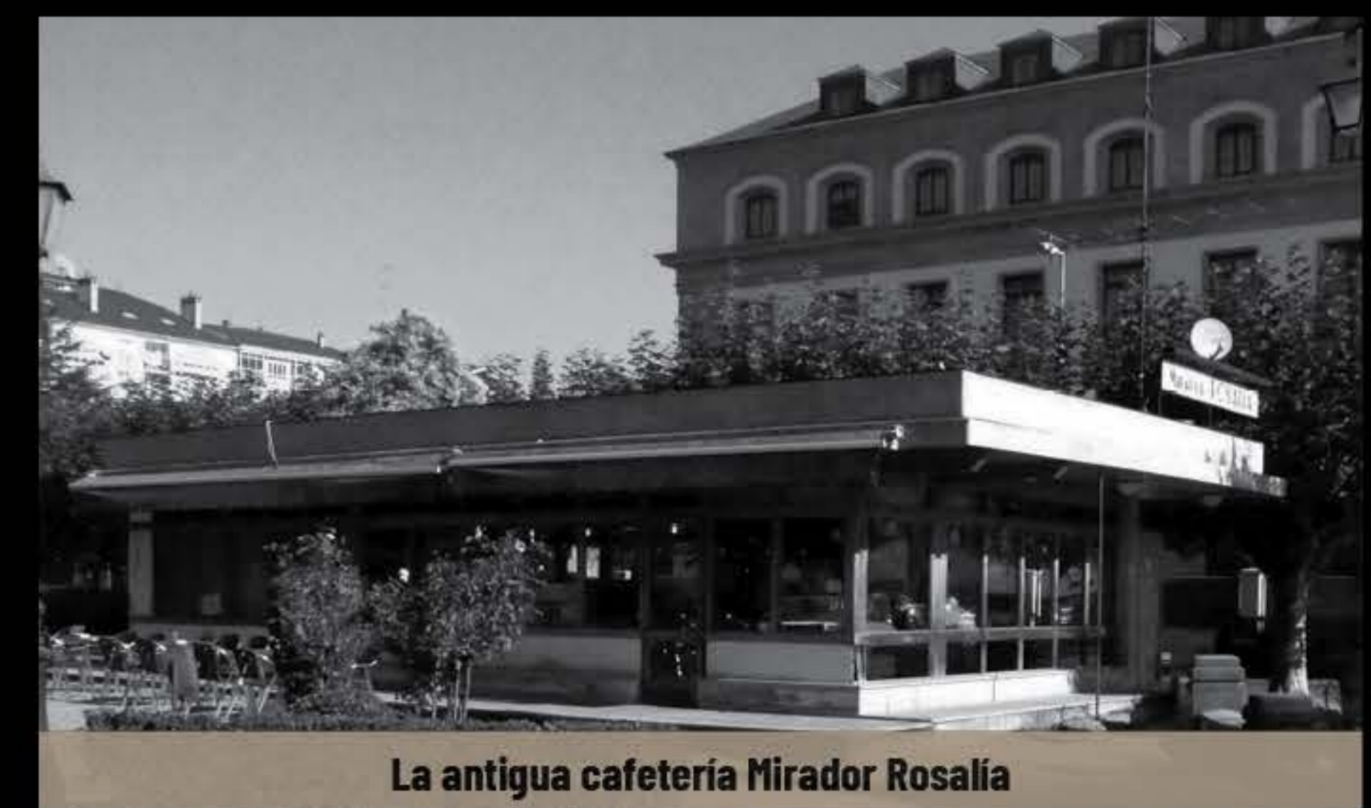
La antigua cafetería Mirador Rosalía

estanque y con la fachada principal orientada al Sur. No sabemos cuando desapareció pero sí que en los años 50 ya no existía.