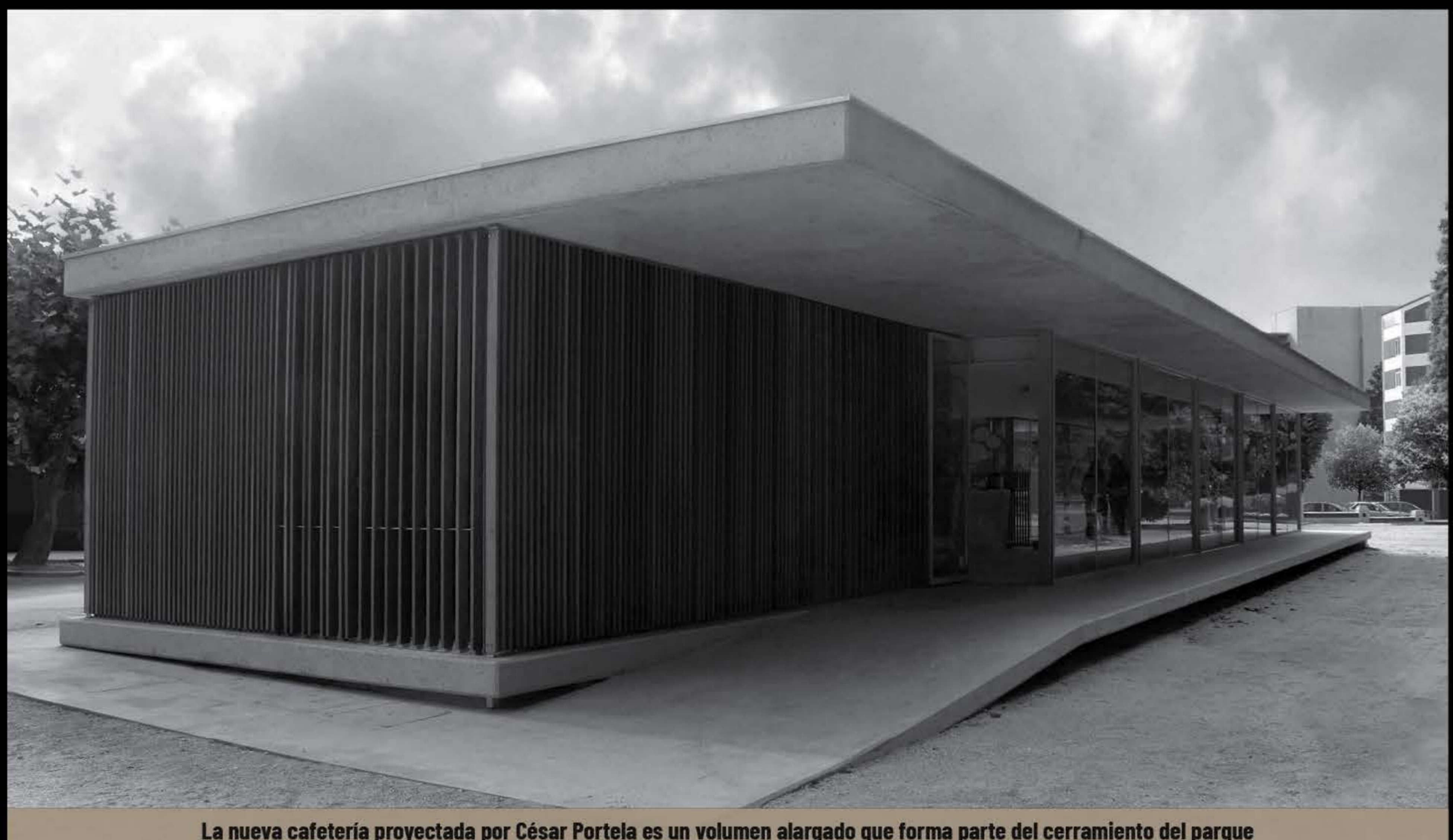
La nueva cafetería proyectada por César Portela es un volumen alargado que forma parte del cerramiento del parque

Para presentar propuestas se publicó el anuncio en el BOP en 1956, 1957 y 1958 sin que hubiese concurrencia. En 1963 se realiza la primera concesión y en 1990 se autorizó la reforma de la edificación.