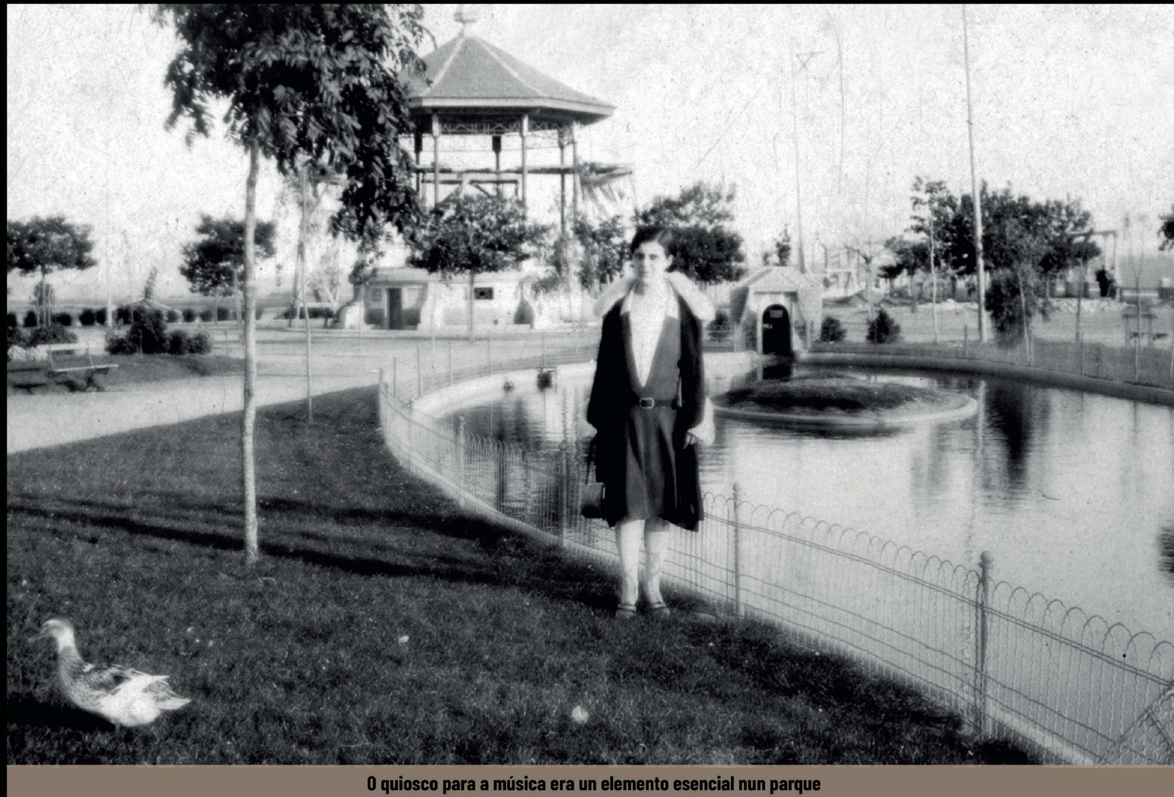
O quiosco para a música era un elemento esencial nun parque

O antigo paseo de coches, ademais de ser utilizado como paseo, é o lugar onde actualmente se instalan as casetas do polbo e atraccións nas Festas de San Froilán, polo que se fixo necesario renovar o pavimento, mellorar o saneamento e o alumado e recuperando así a zona para espaxamento e lecer.