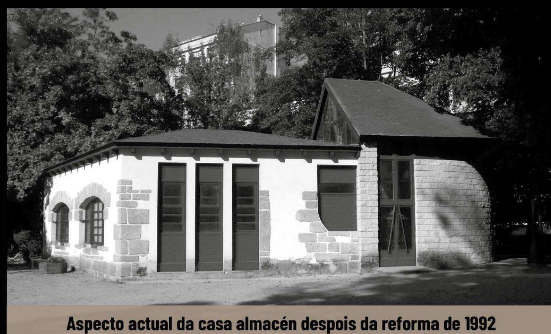
Aspecto actual da casa almacén despois da reforma de 1992

Primeiro edificio que se construíu no parque. Destinado a resgardar plantas delicadas e gardar ferramentas, tamén foi utilizado polo persoal de xardíns, oficina de información do parque, currais de aves e pombal. En 1992 mutilouse ao engadirle outra edificación. O proxecto reformaba a casa para destinala a usos culturais, docentes e divulgativos que non se chegaron a desenvolver.