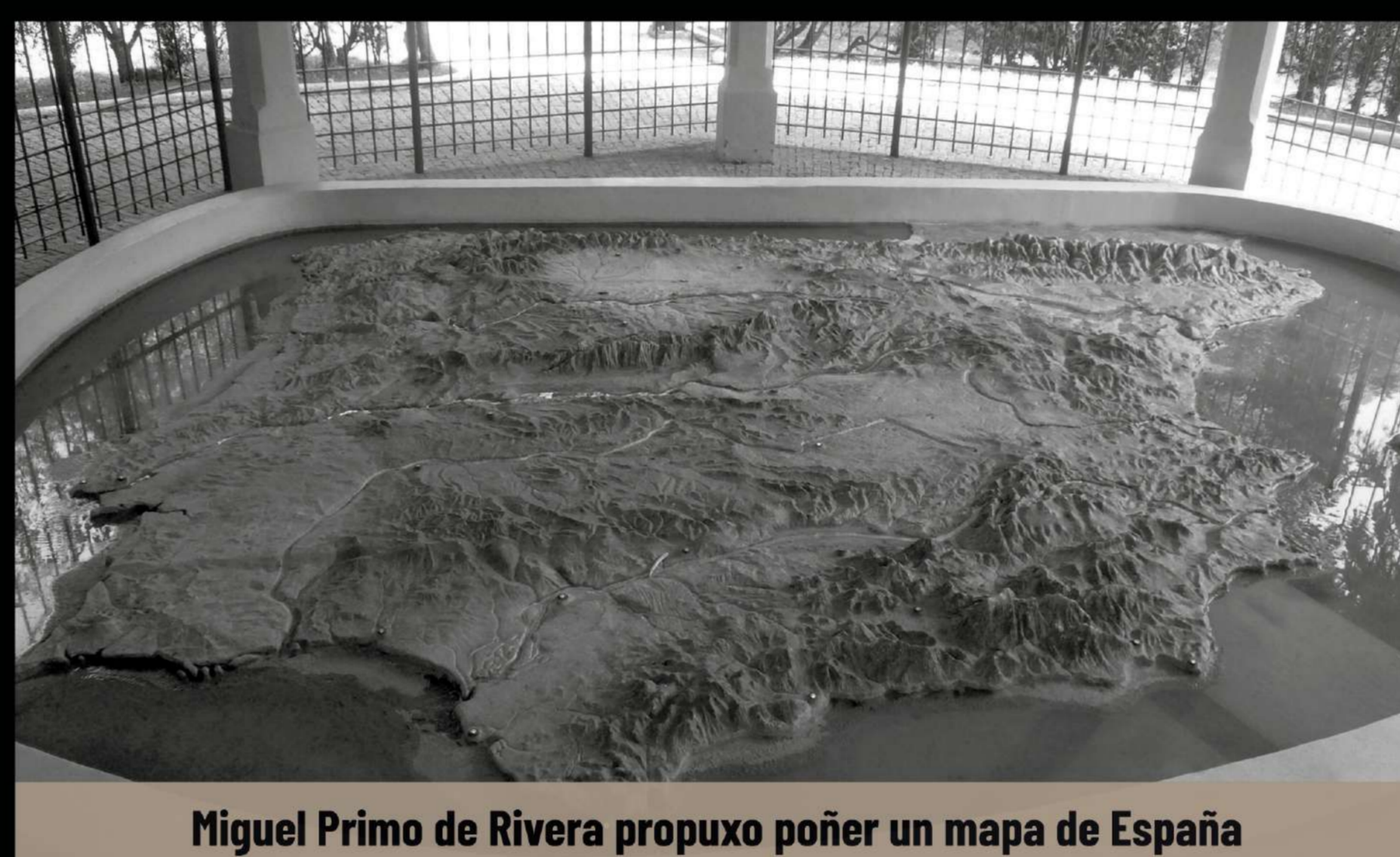
Miguel Primo de Rivera propuxo poñer un mapa de España

Despois da visita de Primo de Rivera, aprobouse a adquisición dun mapa cartográfico da península Ibérica en relevo con iluminación nas capitais de provincias e Lisboa e en catorce faros. Para protexelo construíuse unha cuberta que tamén facía de pombal. Debido aos danos ocasionados polo ciclón Hortensia, en 1985, restaurase a cuberta.