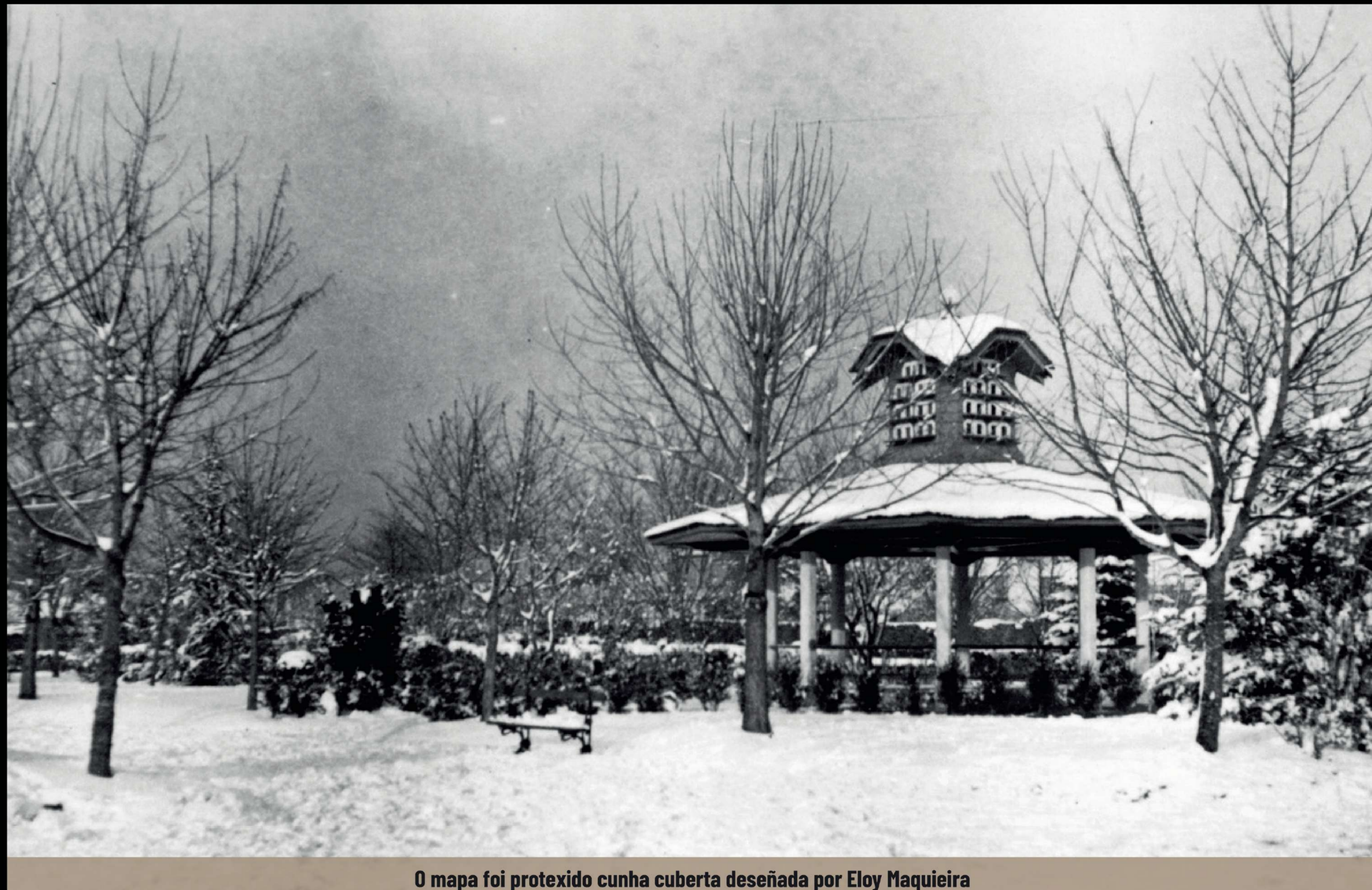
O mapa foi protexido cunha cuberta deseñada por Eloy Maqueira