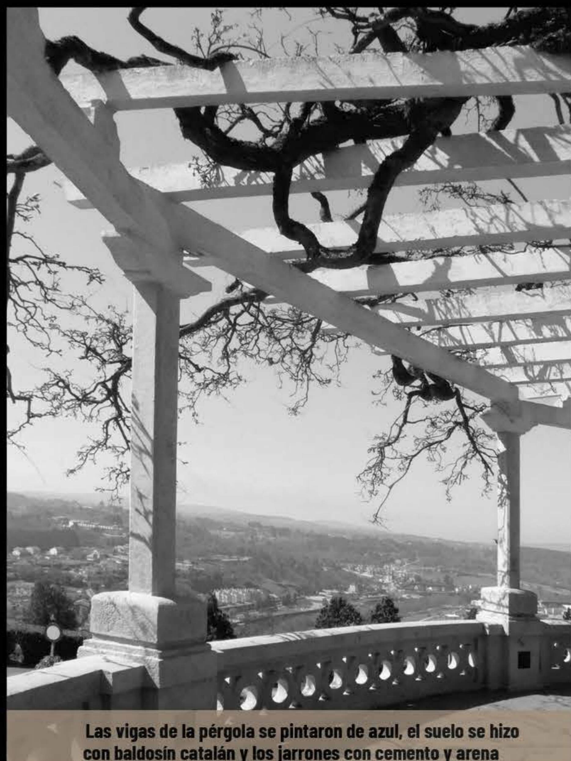
Las vigas de la pérgola se pintaron de azul, el suelo se hizo con baldosin catalán y los jarrones con cemento y arena

longitud de unos 60 metros, para evitar futuras construcciones y la pérdida de vistas, una cuestión que estuvo de actualidad en 2007.