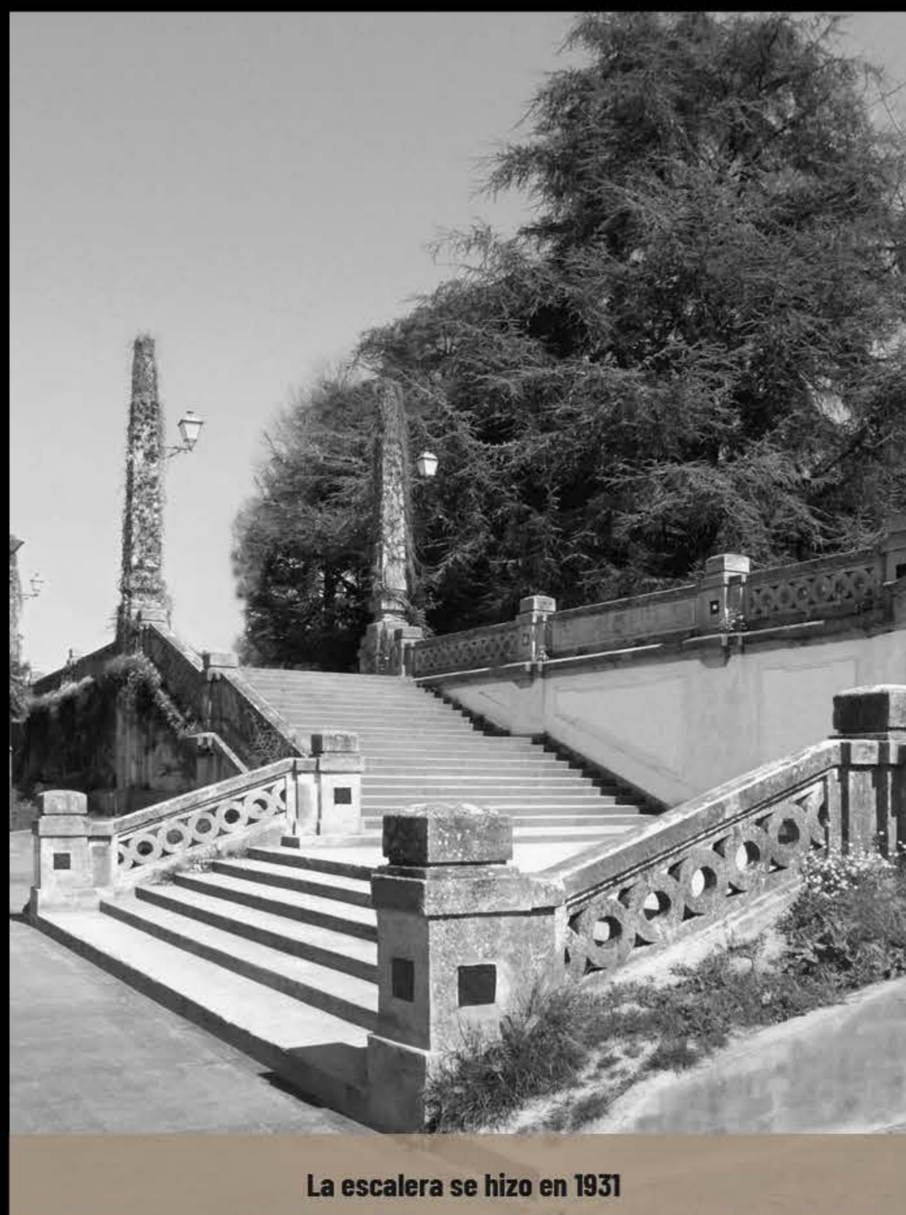
La escalera se hizo en 1931

Destaca del proyecto su diseño, su localización y su carácter integrador entre la ciudad y el parque. Su mérito está en ser de las primeras obras que se hacen en España con hormigón armado, estilo Art Déco.