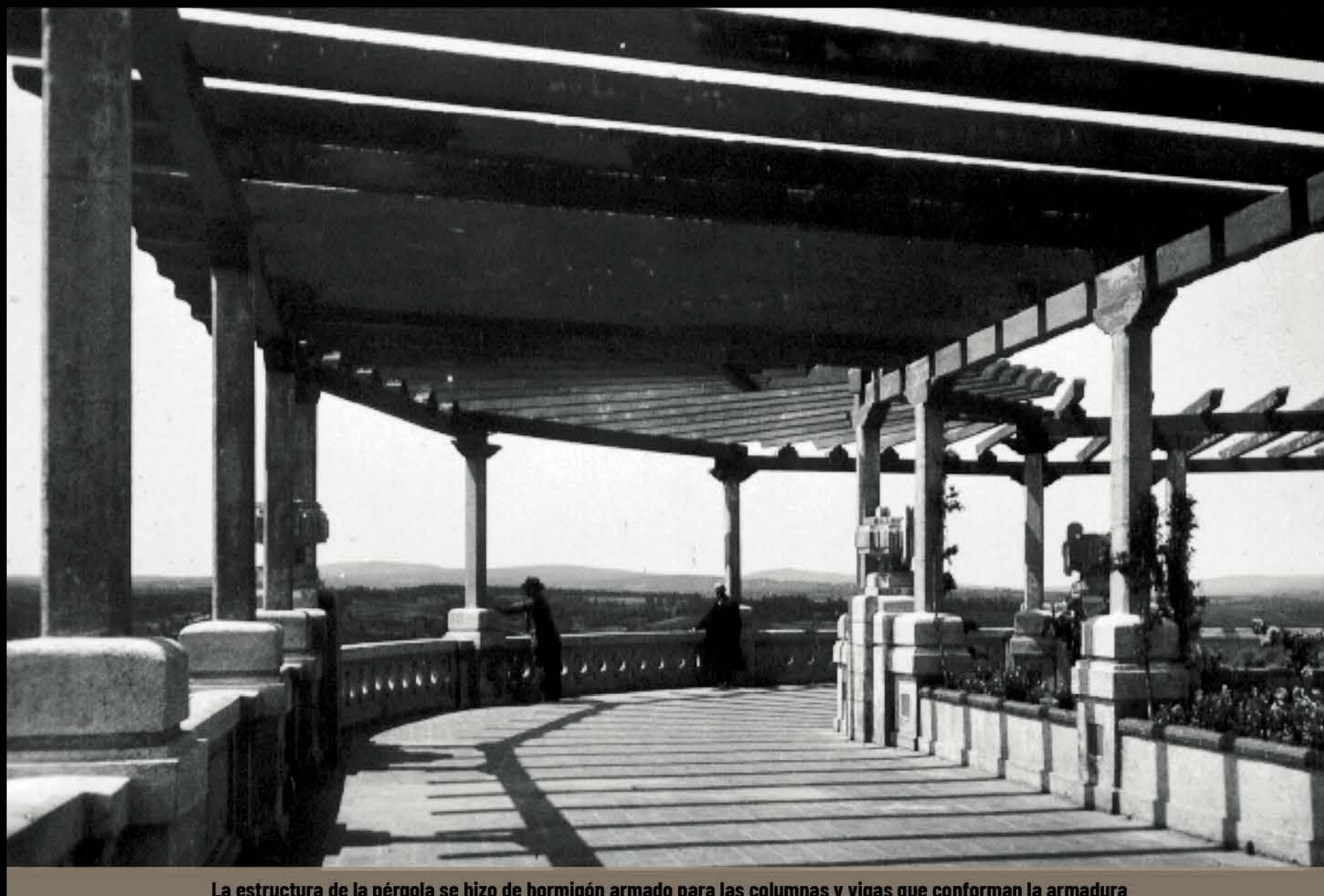
La estructura de la pérgola se hizo de hormigón armado para las columnas y vigas que conforman la armadura

Aprovechando el ángulo de la terraza que limitaba con la prolongación de la avenida de Ángel López Pérez (actual avenida del Doctor García Portela) quiere transformarse esa parte en un espléndido mirador, desde el que disfrutar, a cubierto del sol, el admirable paisaje que ofrece el río Miño.