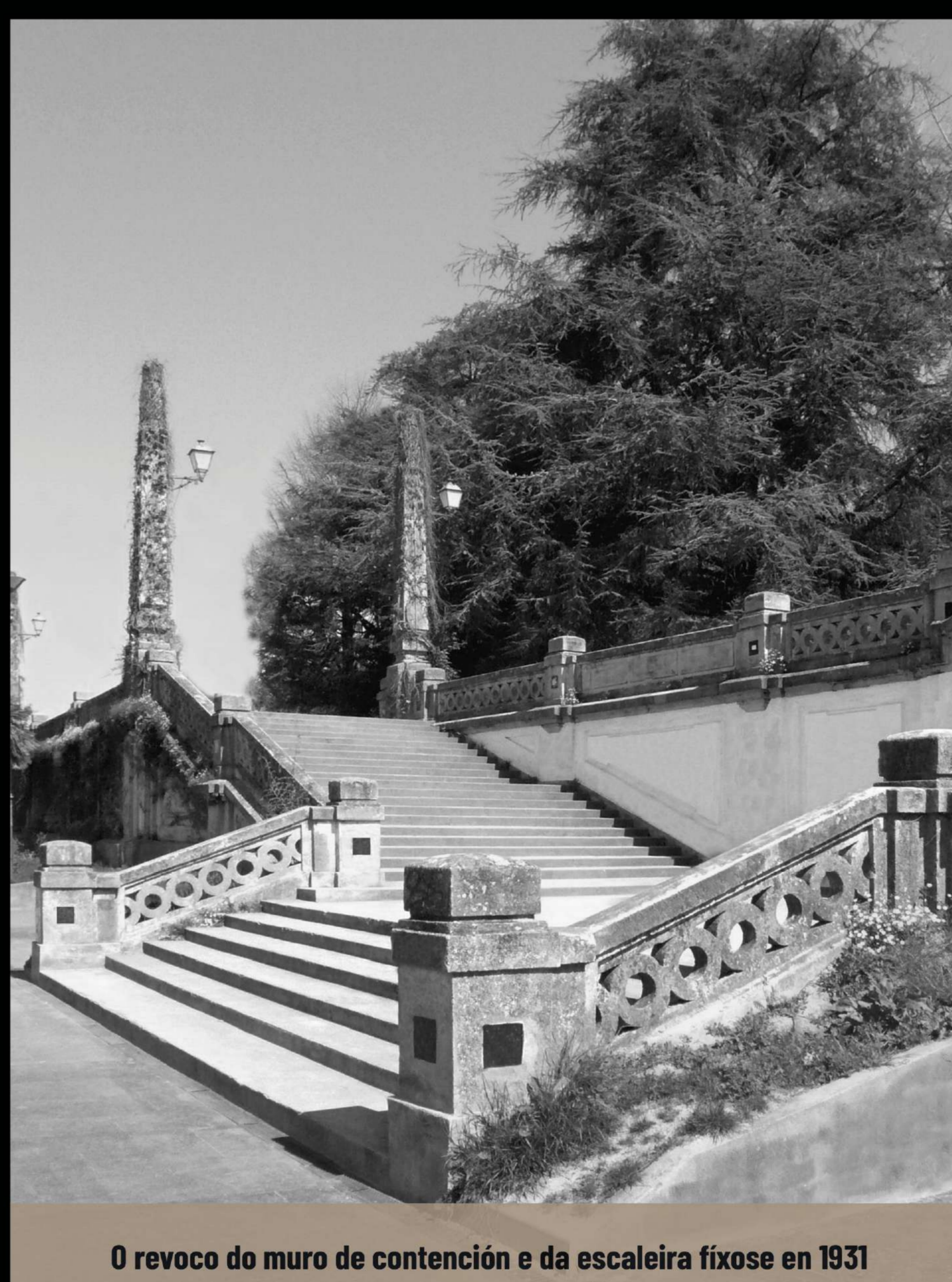
O revoco do muro de contención e da escaleira fíxose en 1931

Destaca do proxecto o seu deseño, a súa localización e o seu carácter integrador entre a cidade e o parque. O seu mérito está en ser das primeiras obras que se fan en España con formigón armado, estilo Art Déco