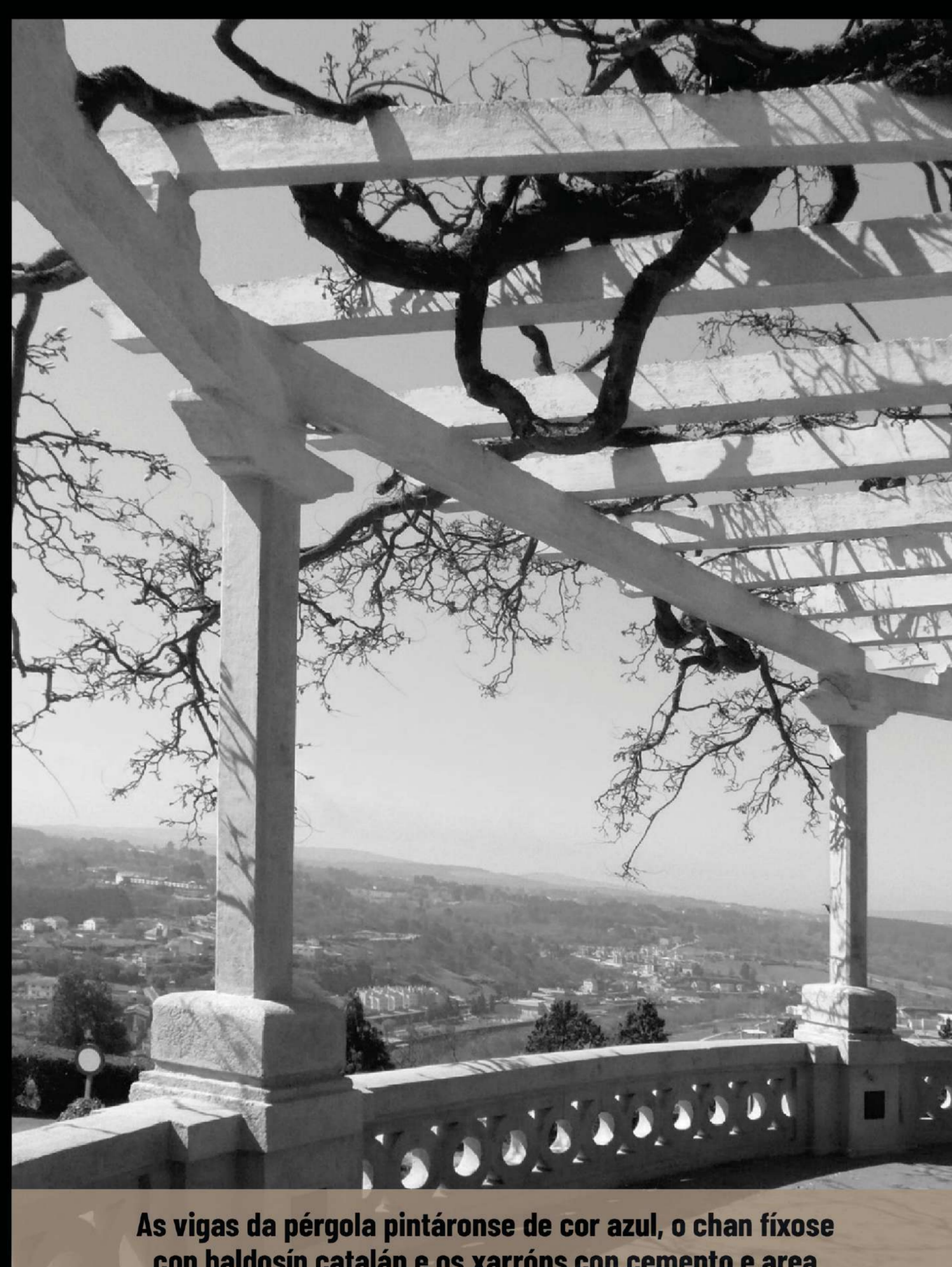
As vigas da pérgola pintáronse de cor azul, o chan fíxose con baldosín catalán e os xarróns con cemento e area

lonxitude duns 60 metros, para evitar futuras construcións e a perda de vistas, unha cuestión que estivo de actualidade no 2007.