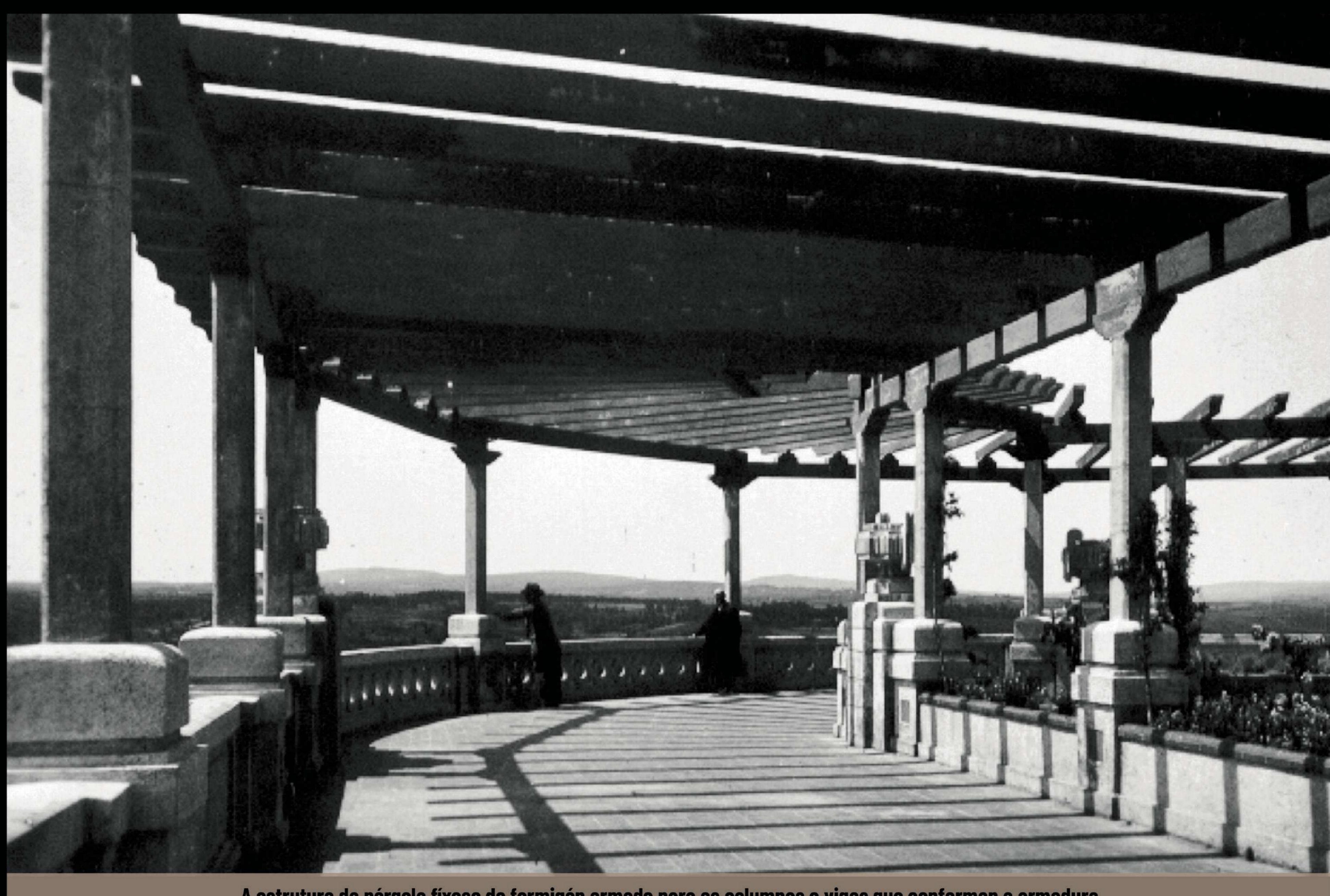
A estrutura da pérgola fíxose de formigón armado para as columnas e vigas que conforman a armadura

Aproveitando o ángulo da terraza que limitaba coa prolongación da avenida de Ángel López Pérez (actual avenida do Doutor García Portela) quere transformarse esa parte nun espléndido miradoiro, desde o que gozar, a cuberto do sol, a admirable paisaxe que ofrece o río Miño.