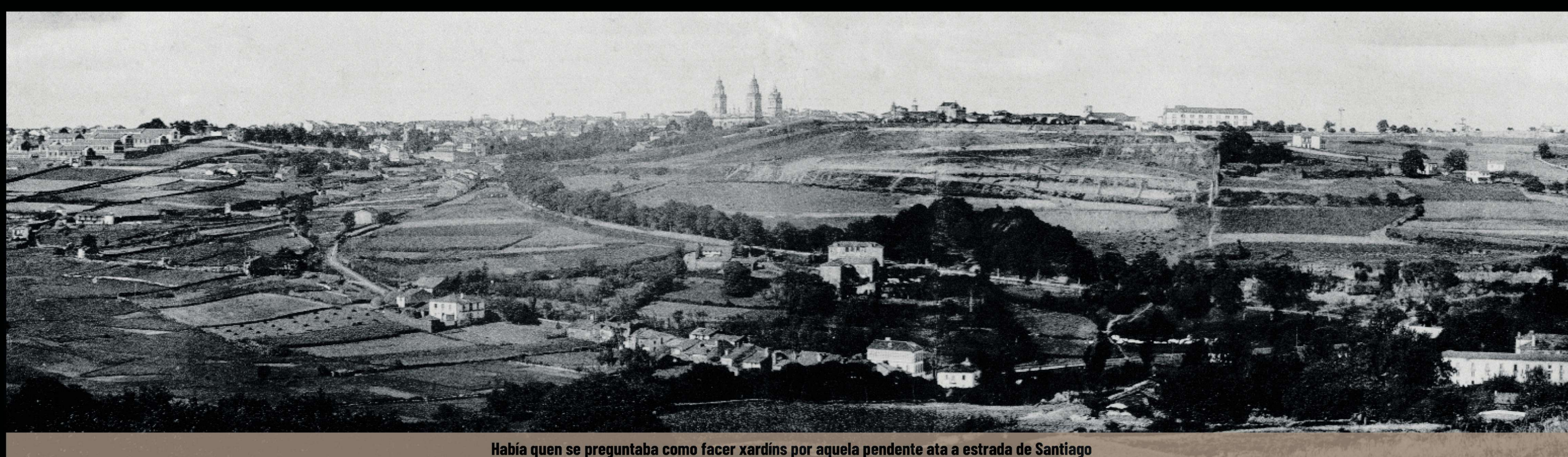
Había quen se preguntaba como facer xardíns por aquela pendente ata a estrada de Santiago

Os desniveis e ondulacións aproveitábanse para construír terrazas e escaleiras no seu primeiro bancal, e as partes planas do segundo bancal, e skating e invernadoiros . Na parte inferior conservábase un vello souto de