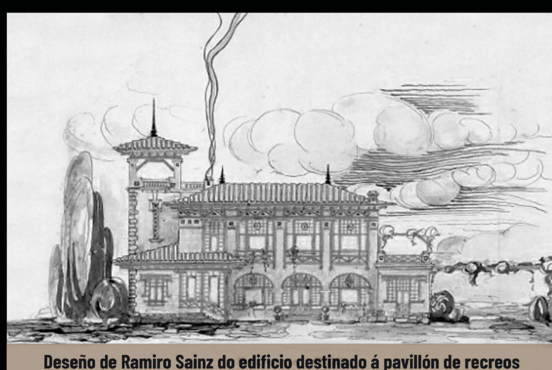
Deseño de Ramiro Sainz do edificio destinado á pavillón de recreos