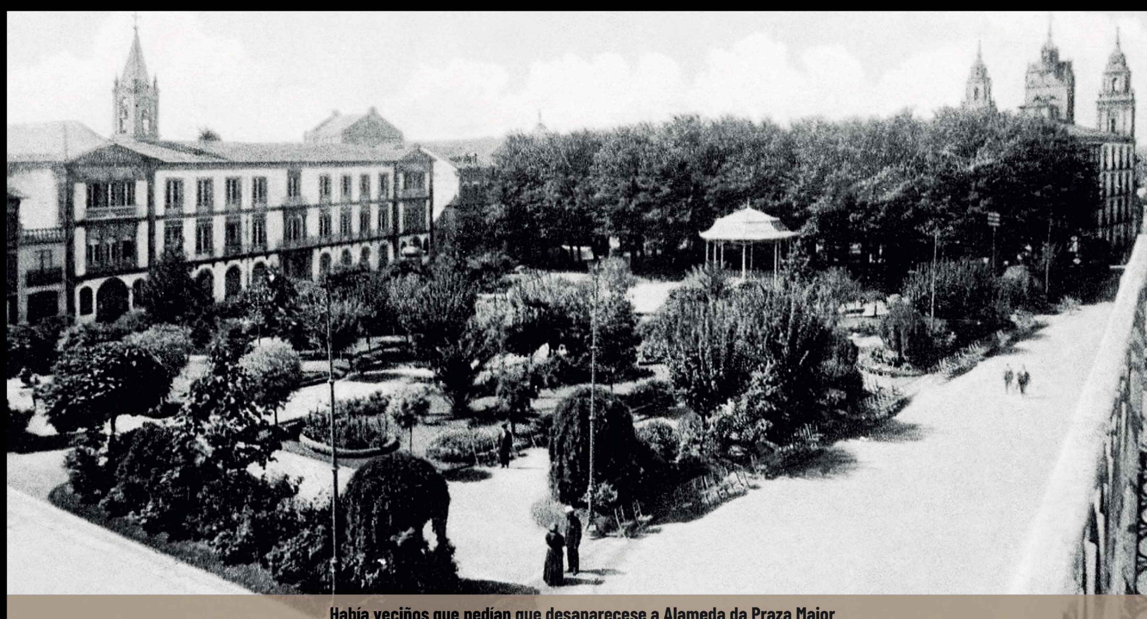
Había veciños que pedían que desaparecese a Alameda da Praza Maior