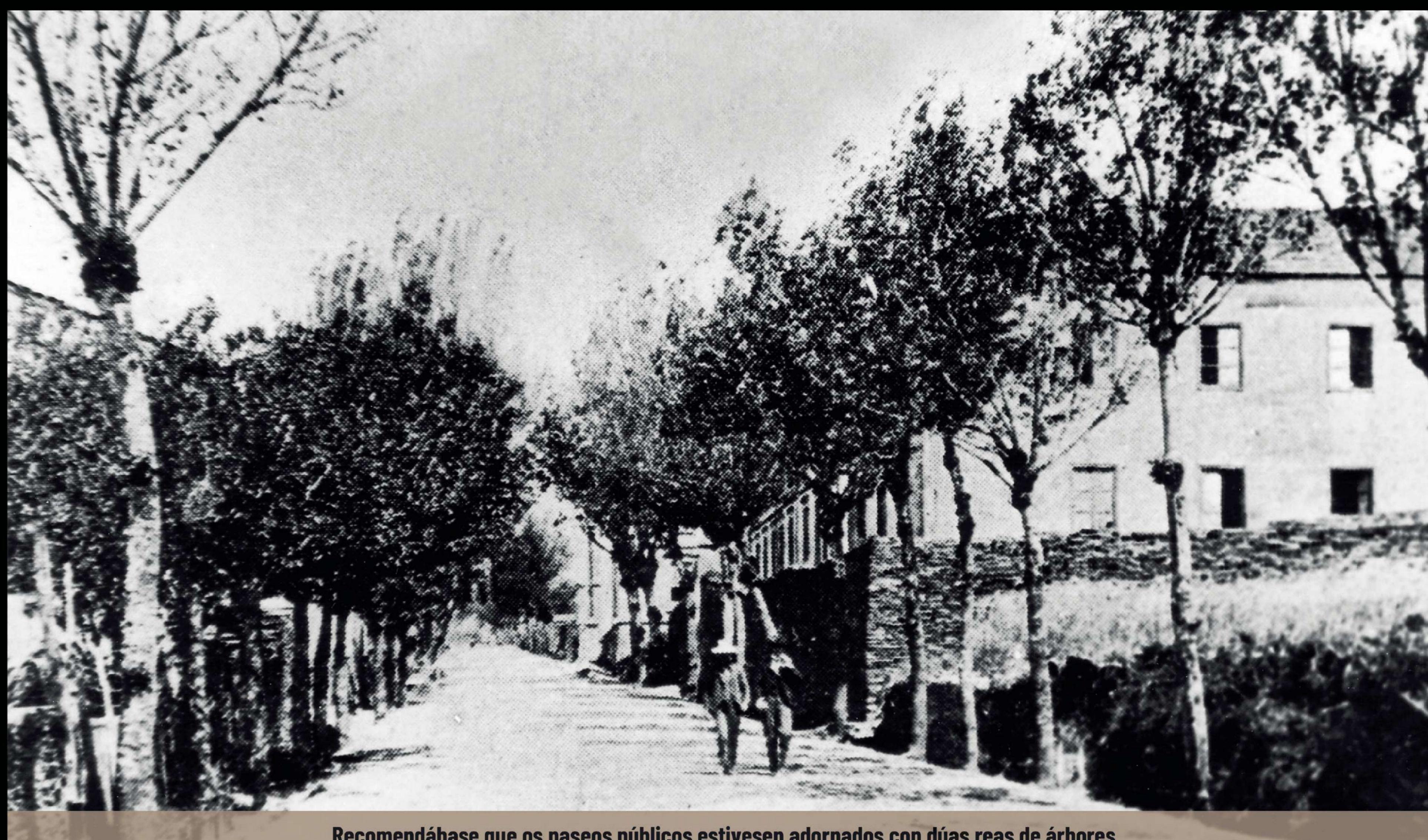
Recomendábase que os paseos públicos estivesen adornados con dúas reas de árbores

O proceso para integrar artificialmente á natureza ao espazo urbano comeza na segunda metade do s. XVIII, prestando atencións aos paseos delimitados con árbores, como o que existía ao redor da muralla e á saída dos camiños xerais ou reais. Na segunda metade do s. XIX, aos poucos, foron aparecendo xardíns para