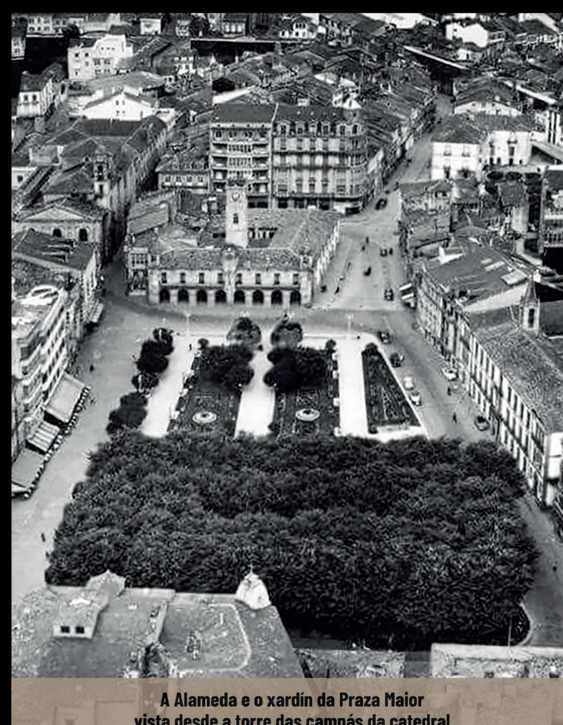
A Alameda e o xardín da Praza Maior vista desde a torre das campás da catedral

O parque estaba destinado a que os nenos puidesen xogar con liberdade, que practicasen toda clase de deportes, que as persoas maiores tivesen un axeitado lugar de descanso, de esparexemento e que se culturizasen con bibliotecas circulantes. Pero tamén era o lugar propicio para que o obreiro gozase do seu tempo libre en lugar de frecuentar as tabernas, lugares pechados, insáns, e